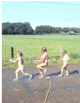
tijdelijk informeel spelen