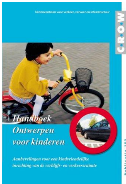
ontwerp aanbevelingen informele speelplaatsen

Ook is het mogelijk om in de verharding tegels met cijfers of voetsporen van dieren te leggen. Door het toepassen van bepaalde betonelementen als poefs, bollen en palen, die ook geschikt zijn voor (bok)springen, balanceren en zitten, kan de bespeelbaarheid van de straten vergroot worden. Daarnaast kan er veel speelruimte ontsloten worden door onnodige verkeersstromen te voorkomen, veilige oversteekpunten te creëren, meer centraal te parkeren en hofjes toe te passen in nieuwbouwsituaties en bij herinrichting ook in bestaande situaties. In straten waar de doelgroep woont, zou ruimte moeten zijn voor spelen op straat 'onder het keukenraam'.