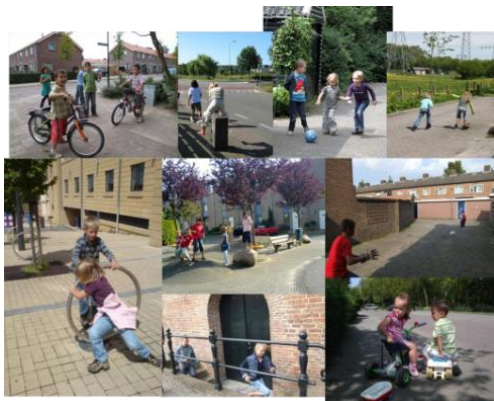
informeel spelen op straat

Op eenvoudige wijze kunnen verkeerstechnische elementen aangepast worden zodat ze als nevenfunctie spelen krijgen. Het maakt bijvoorbeeld niet uit welk soort verharding wordt toegepast. In plaats van standaardtegels 30 x 30 grijs kan gedacht worden deze af te wisselen met gekleurde tegels zodat er vakken of patronen ontstaan.