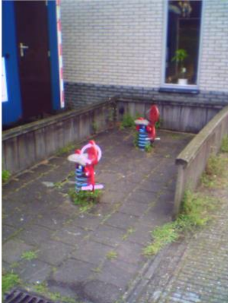
Zo moet het niet

Visie is ambitie en ambitie staat voor een kwaliteitsniveau. Als we een visie formuleren dan geeft deze het wensbeeld aan waar speelplaatsen aan moeten voldoen. We zouden het wensbeeld eigenlijk aan alle kinderen willen voorleggen, maar dan wordt het wensbeeld te breed. Kinderen verdelen we wat betreft speelplaatsen in drie categorieën: 0 t/m 5 jaar, 6 t/m 11 jaar en 12 t/m 18 jaar en iedere categorie heeft een ander ideaalbeeld van zijn speelplaats. De wensen van de kinderen op gebied van spelen veranderen naarmate ze ouder en meer "speelervaren" worden.