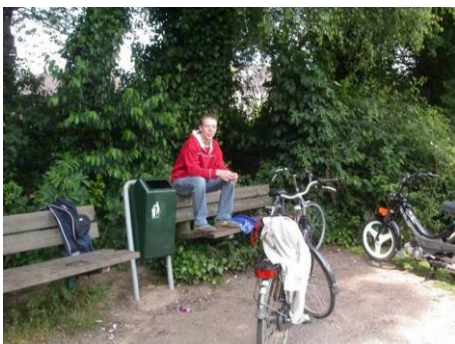
informele ontmoetingsplaats van jongeren

De jeugd gaat steeds verder de buurt in. Haar verkenningsgebied is vrijwel de gehele openbare ruimte. Wanneer we door een buurt lopen waar veel kinderen wonen, zullen we vrijwel in ieder plantsoen, langs iedere sloot, op elk stuk rustige verharding en op menige blinde muur de sporen van spel aantreffen.